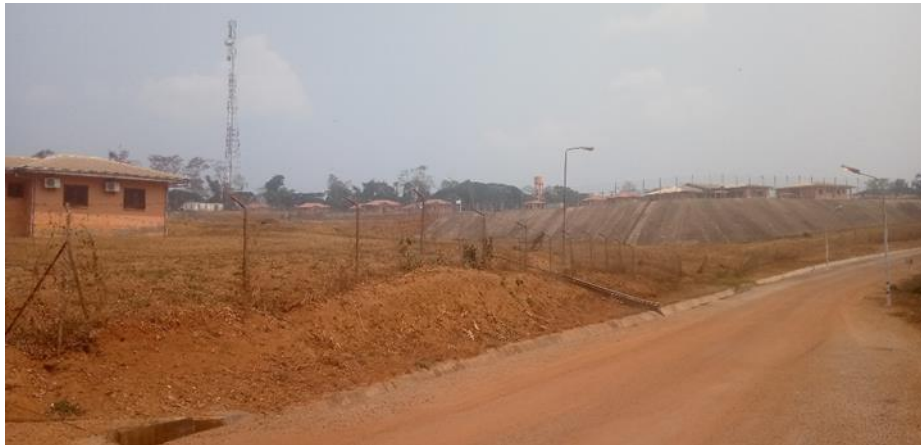
Figure 4 : Clôture provisoire en grillage et piquets métalliques