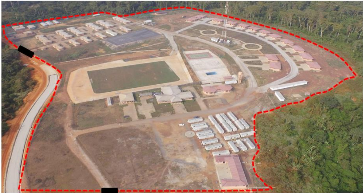
Figure 1 : Vue de la clôture à construire autour de la cité

Au regard de l'importance des investissements réalisés pour le Projet Hydroélectrique de Lom Pangar, EDC envisage implémenter pour l'année 2023 des actions concourant au renforcement du système sécuritaire sur le site de l'Aménagement Hydroélectrique de Lom Pangar.