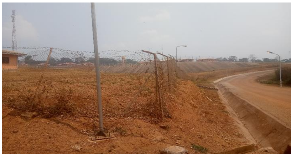
Figure 3 : Mauvais état de la clôture de la cité

À partir des délimitations existantes sur le terrain, nous avons pu effectuer des mesures et déterminer la trajectoire de la clôture actuelle de la cité. La campagne de métré sur le site nous a permis d'estimer le linéaire de la clôture à deux (02) kilomètres