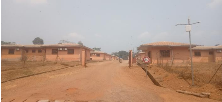
Figure 2 : Entrée principale de la cité du barrage de Lom-Pangar